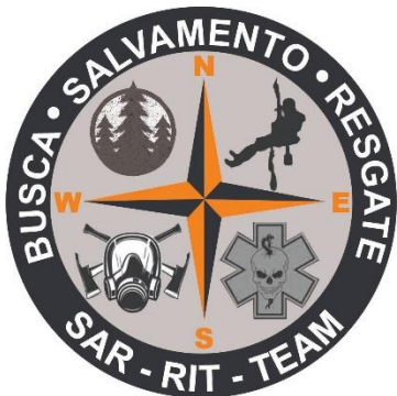
Departamento de Rápida Intervenção Tática, Busca e Resgate