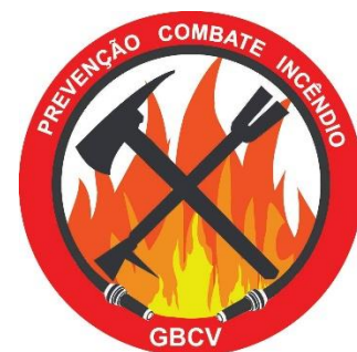
Departamento de Prevenção e Combate a Incêndios