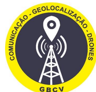
Departamento de Comunicação, Geolocalização e Drones