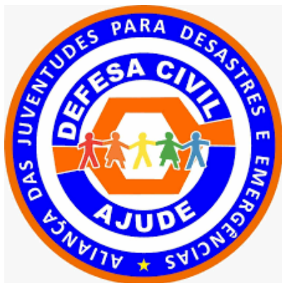
Departamento da Aliança das Juventudes para Desastres e Emergências