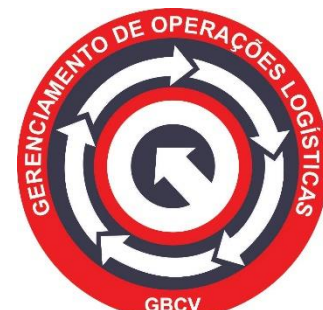
Departamento de Gerenciamento de Operações e Logística