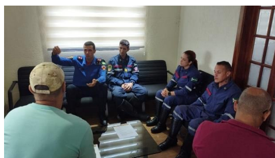
GBCV em Jarinu em 2023