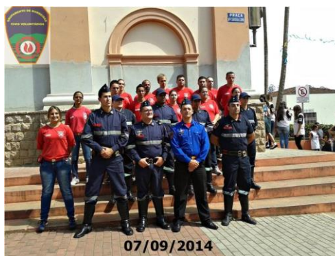
GBCV em Jarinu em 2014

A reunião foi muito produtiva e agora o GBCV aguarda um retorno da Câmara Municipal e da Prefeitura de Jarinu para dar continuidade ao projeto de implantação do GBCV em Jarinu.